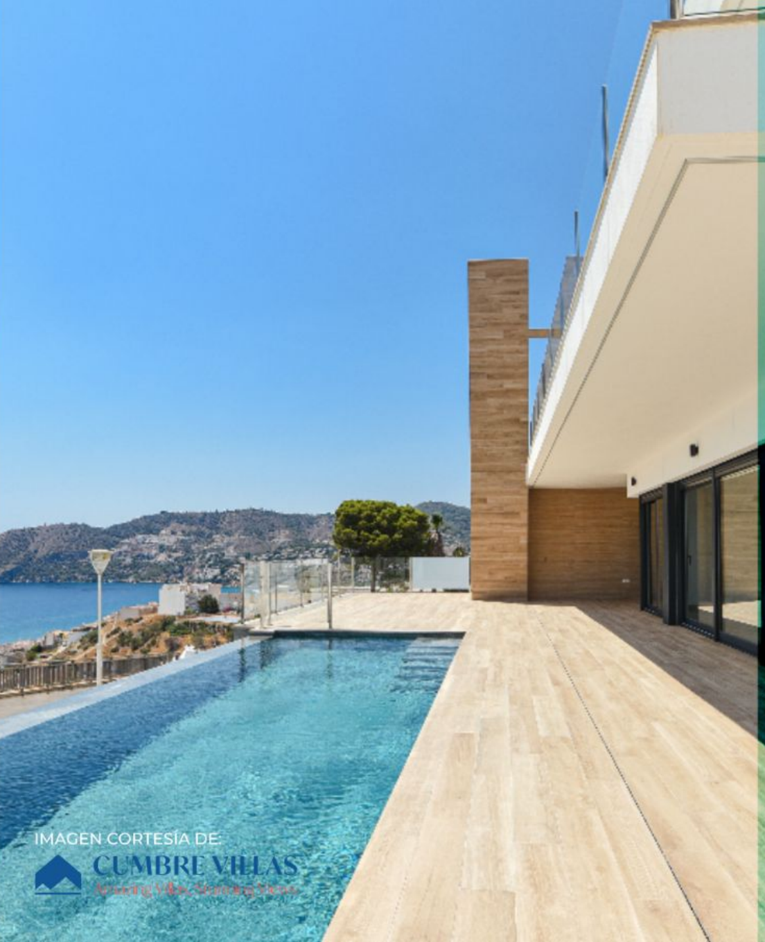
IMAGEN CORTESÍA DE CUMBRE VILLAS Asociación de Vecinos de Cumbre Villas